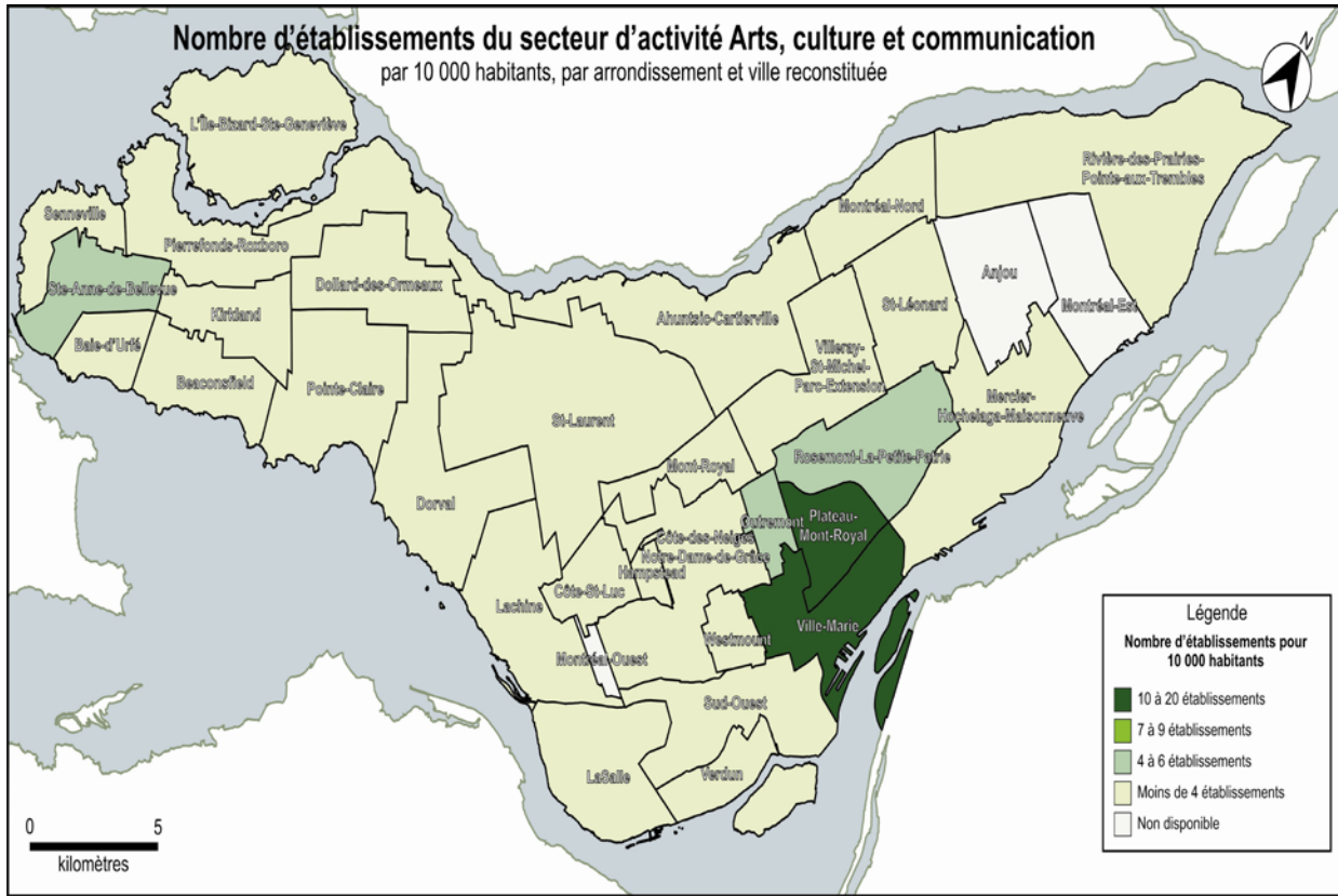
CARTE 2 Les territoires des organisations culturelles